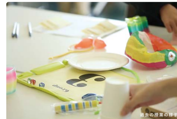
過去の授業の様子

今回のななめな学校は、2日間で5つの小学生向けの授業を開催します。小学生は、最大4つの授業に申し込むことができます。大人向けの授業は、保護者の方や、18歳以上の方がご参加できます。授業によっては作ったものを持ち帰ることができます。